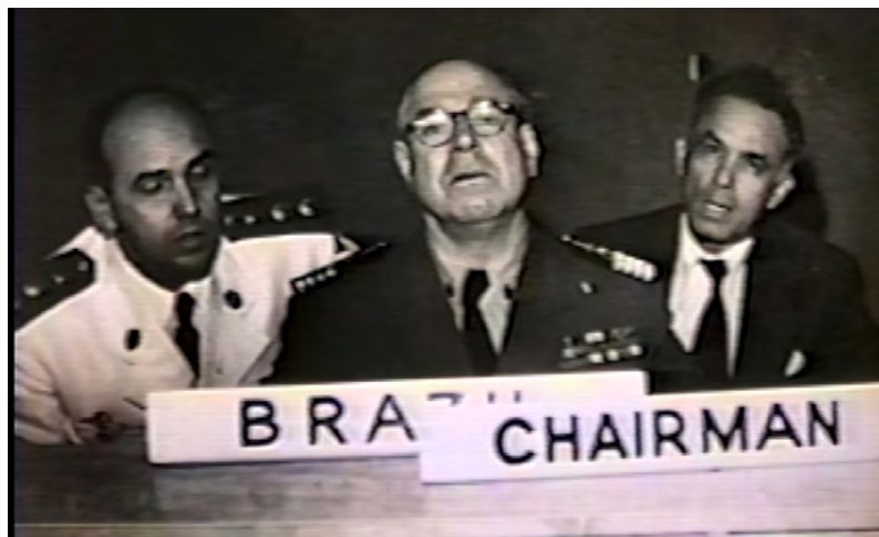
O Almirante Álvaro Alberto defendendo os interesses do Brasil na Comissão de Energia Atômica do Conselho de Segurança das Nações Unidas (ABEN, 1996) (USP, 2023)

momento sua luta para defender o acesso brasileiro à tecnologia nuclear. Posicionou-se contra o controle internacional das jazidas de minerais atômicos e formulou o princípio das compensações específicas, pelo qual o País só deveria comercializar estes minerais em troca do acesso à tecnologia nuclear (ABEN, 1996) (USP, 2023).