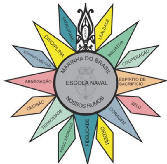
Rosa das Virtudes – EN

Aprimorar a qualificação de pessoal da MB é uma ação estratégica, “a fim de prover à Força a pessoa certa, com a capacitação adequada, no lugar e no momento certo, visando ao cumpri-