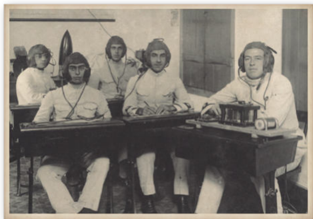
Escola de Aviação Naval em 1922

Quanto aos oficiais e praças, as lacunas, principalmente em relação à experiência, foram supridas com a contratação de estrangeiros. A preocupação com uma Força Naval eficiente, com poder de dissuasão e com militares capacitados já se fazia presente. Esses militares experientes, de certa forma, seriam os responsáveis pela transferência do conhecimento.