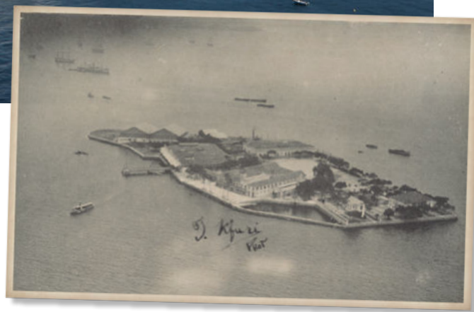
Vista aérea da Ilha das Enxadas em 1922, onde era sediada a Escola Naval que lá permaneceu até 1938, quando passou a fixar-se na Ilha de Villegagnon (foto maior)