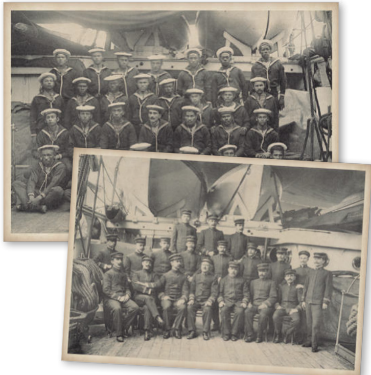
Oficialidade e um grupo de marinheiros do Cruzador “Benjamin Constant”, incorporado em 1894, apelidado de “Garça-Branca” e “Beijoca” pela marinhagem (1906)

Com a criação da Escola Politécnica de Lisboa, em 1837, com foco na reorganização do ensino naval, constata-se, já àquela época, um debate acerca do que ensinar, entre os que defendiam o ensino técnico, dominado pela Geometria e Trigonometria, e aqueles diretamente envolvidos com o mar, que defendiam as atitudes e habilidades relacionadas à liderança e ao