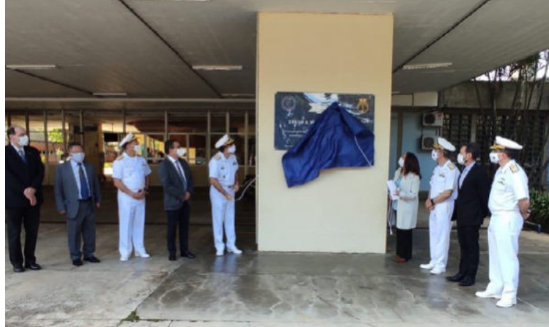
65 anos de parceria entre a Marinha do Brasil e a Universidade de São Paulo (USP)

O fortalecimento do ensino na MB extrapolou a instituição e trouxe contribuições no ensino civil e para a sociedade. A Marinha mantém, desde 1956, um convênio acadêmico-científico com a Universidade de São Paulo (USP). Essa parceria resultou no primeiro curso de Engenharia Naval no Brasil, fazendo parte da história da Engenharia no País. Desde então, foi possível formar mais de quinhentos oficiais engenheiros para a Marinha e, aproximadamente,