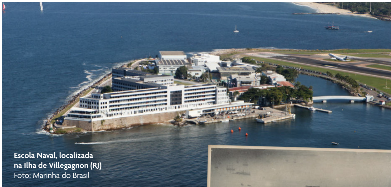
Escola Naval, localizada na Ilha de Villegagnon (RJ)