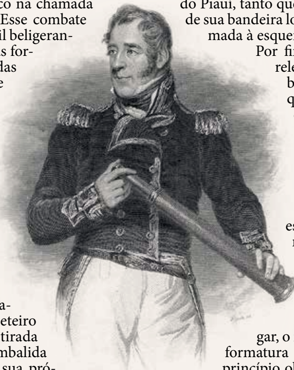
Lorde Thomas Cochrane, combatente escocês contratado por Dom Pedro I para comandar a Marinha brasileira

lusitanos tenham conseguido afastar os navios imperiais, ao final Cochrane voltou de Morro de São Paulo, próximo de Salvador e bloqueou esse porto. Não se tem certeza do número de mortos nesse combate. Atrevo-me a considerar um máximo de quinze mortos em ambos os lados.