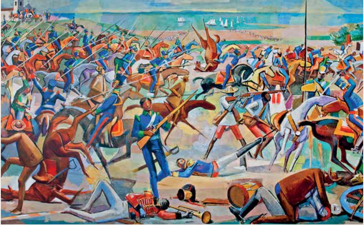
A Batalha de Pirajá, marco na chamada Independência da Bahia Mural de Carybé

rei. O próprio conceito de nacionalidade teve o seu início com a Revolução Francesa quando se criou o conceito de “cidadão” não mais ligando sua lealdade ao monarca, mas sim a um Estado-Nação, uma entidade política de cariz psicológico-social. Não à toa os revolucionários franceses criaram a Marianne, uma idealização daquela república jovem, bela e generosa que “protegeria” todos os cidadãos, como um traço de união espiritual do povo com a Nação.