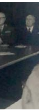
Robert Oppenheimer em visita ao IPqM