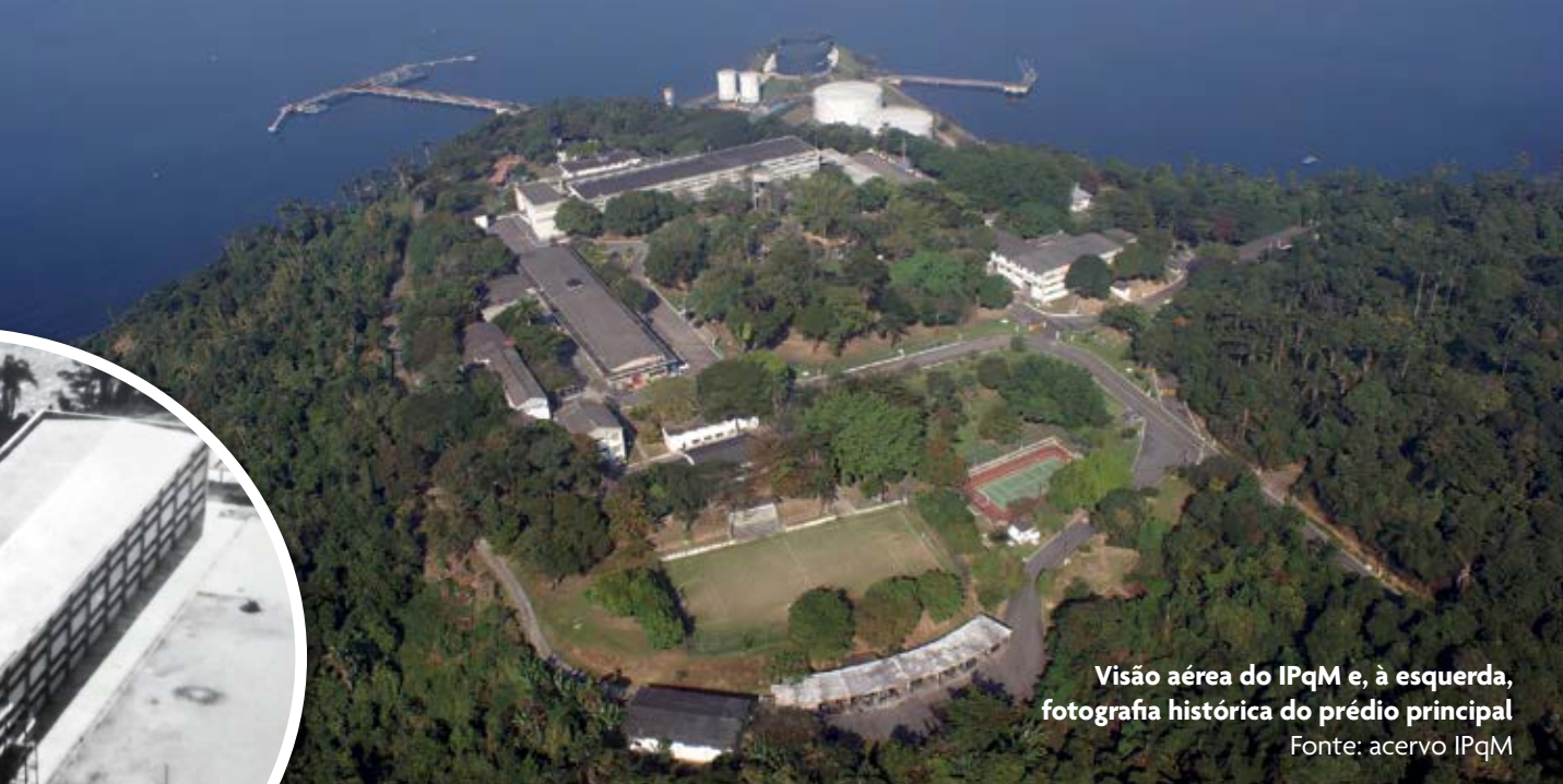
Visão aérea do IPqM e, à esquerda, fotografia histórica do prédio principal

pela força material de suas armas. Homens, entretanto, que não podem ser exceções entre os brasileiros, e armas que serão enganosas se não emanarem de uma indústria produtiva e progressista, integrada numa sólida economia nacional (...).”